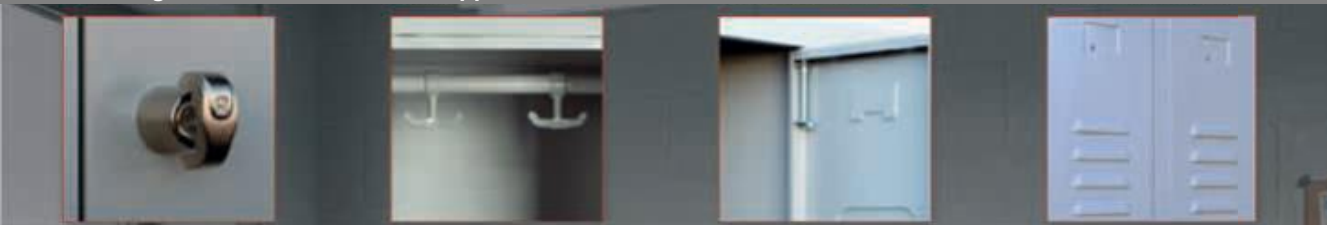
4/ Etikettenhalter & Schlitze